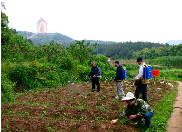
东林净土苑护法团义工在菜地喷洒大悲水