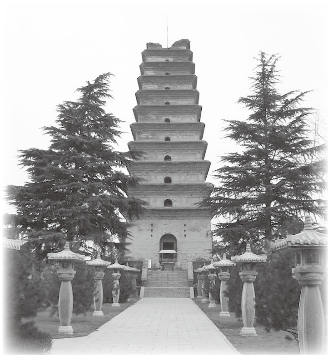
西安香积寺善导大师塔